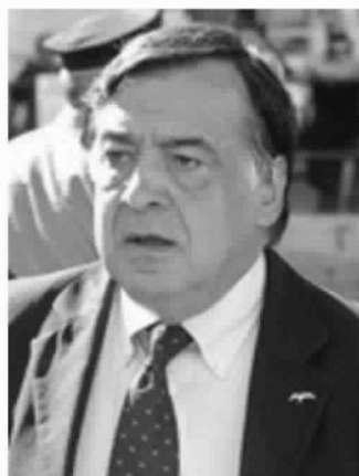
ULTIMO TRA I GRANDI Leoluca Orlando, sindaco di Palermo

Da ogni cittadino, in media, i Comuni avrebbero dovuto incassare nel quinquennio 2008-2012 (questi i dati più recenti) 882 euro l'anno fra tributi (565 euro) e tariffe (318 eu-