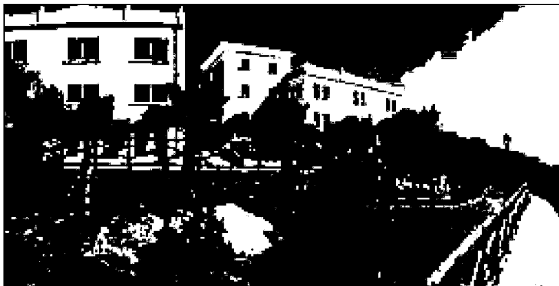
La nuova sede dell'Anutel

Un'aula magna da 100 posti a cui si affiancano due aule di 56 posti ciascuna e due aule informatiche con monitor e pc in rete per permettere la condivisione degli eventi organizzati. L'Anutel, Associazione nazionale uffici tributi enti locali, festeggia venerdì 26 settembre il proprio ventennale con il taglio del nastro della Scuola